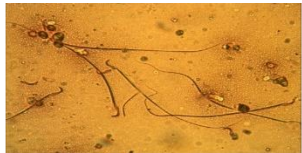
Gambar 1. Lost Head, Lost Tail, dan ekor bengkok